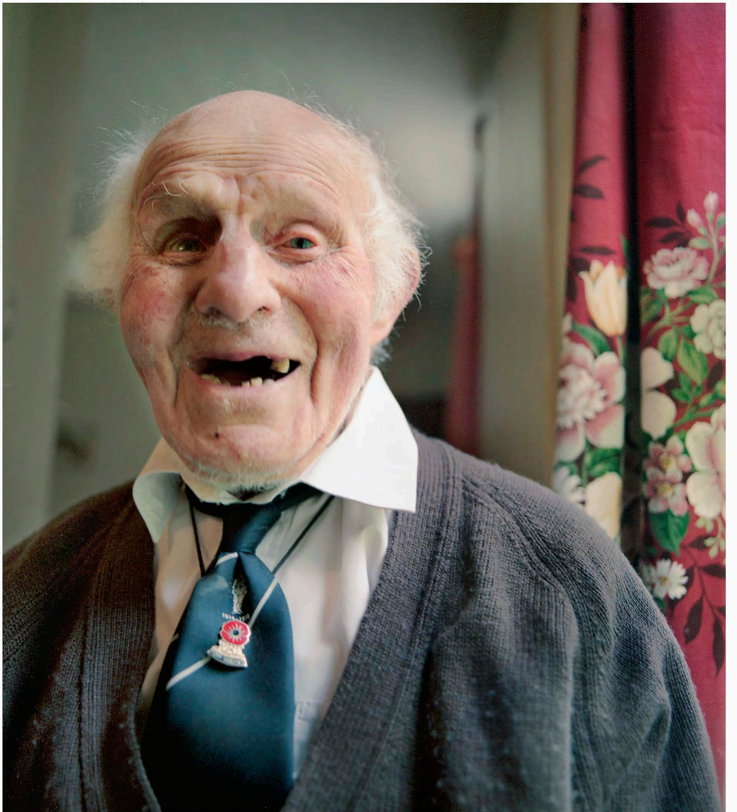
På slipsen har Smiler nålen som visar att han är medlem i The Royal British Legion, en organisation som bildades för att förbättra tillvaron för brittiska krigsveteraner.

Namnet Smiler fick han när han låg vid fronten i Frankrike. På en tillsägelse från ett befäl kunde han inte hålla sig för skratt utan ▶