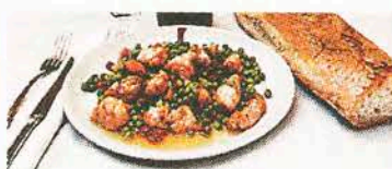
På vita duken