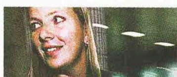
Hon får s att se rött