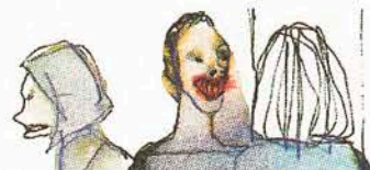
Konsten eller livet